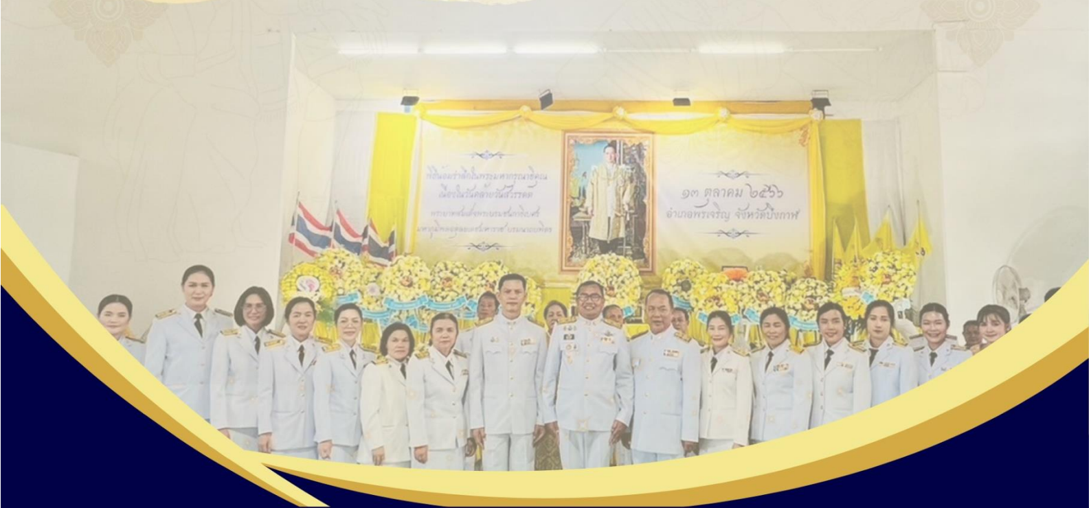
โรงเรียนพรเจริญวิทยา สำนักงานเขตพื้นที่การศึกษามัธยมศึกษาบึงกาฬ